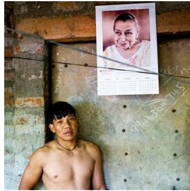
Aldo Sperber / Picturetank SPA0337105

UTILISATIONS EDITORIALES RESPECTANT LEGENDE ET CONTEXTE. AVEC AUTORISATION SIGNEE OU ORALE. Infos : +33(0)143 15 63 53.