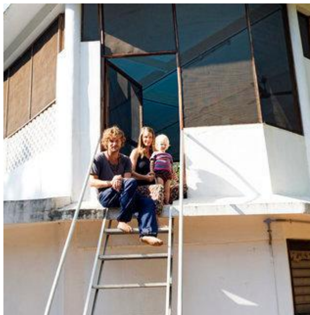
Aldo Sperber / Picturetank SPA0337103

UTILISATIONS EDITORIALES RESPECTANT LEGENDE ET CONTEXTE. AVEC AUTORISATION SIGNEE OU ORALE. Infos : +33(0)143 15 63 53.