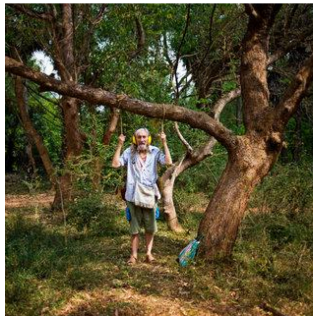
Aldo Sperber / Picturetank SPA0337145

UTILISATIONS EDITORIALES RESPECTANT LEGENDE ET CONTEXTE. AVEC AUTORISATION SIGNEE OU ORALE. Infos : +33(0)143 15 63 53.