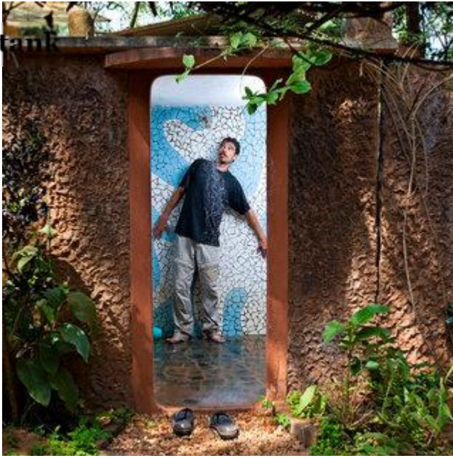
Aldo Sperber / Picturetank SPA0337146

Xavier est né en Côte d'Ivoire. Il a vécu à Pondichéry où son père était proviseur du lycée français. Il est officiellement devenu aurovillien en 1994. Après avoir travaillé dans la restauration et dans l'import-export, il est aujourd'hui manager de la jolie Rêve's guest house. Son fils a 15 ans et étudie au lycée français de Pondichéry après avoir fait la plus grande partie de sa scolarité à Auroville.