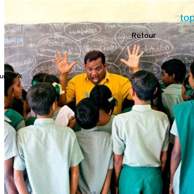
Aldo Sperber / Picturetank SPA0337136

UTILISATIONS EDITORIALES RESPECTANT LEGENDE ET CONTEXTE. AVEC AUTORISATION SIGNEE OU ORALE. Infos : +33(0)143 15 63 53.