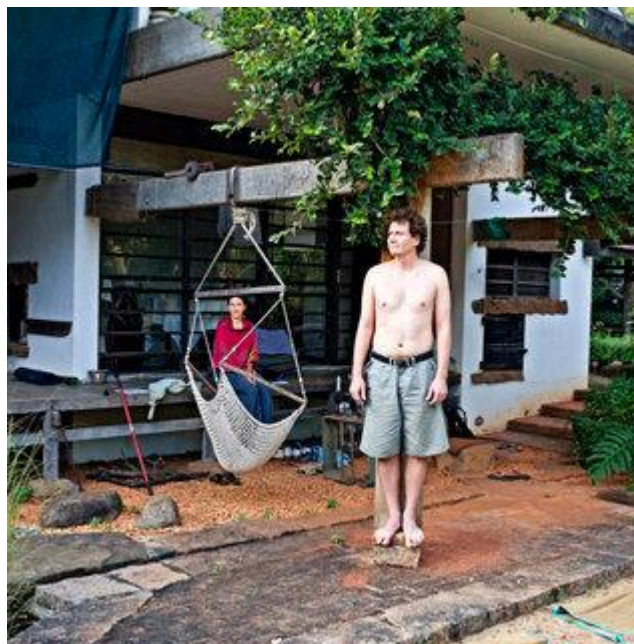
Aldo Sperber / Picturetank SPA0337126

UTILISATIONS EDITORIALES RESPECTANT LEGENDE ET