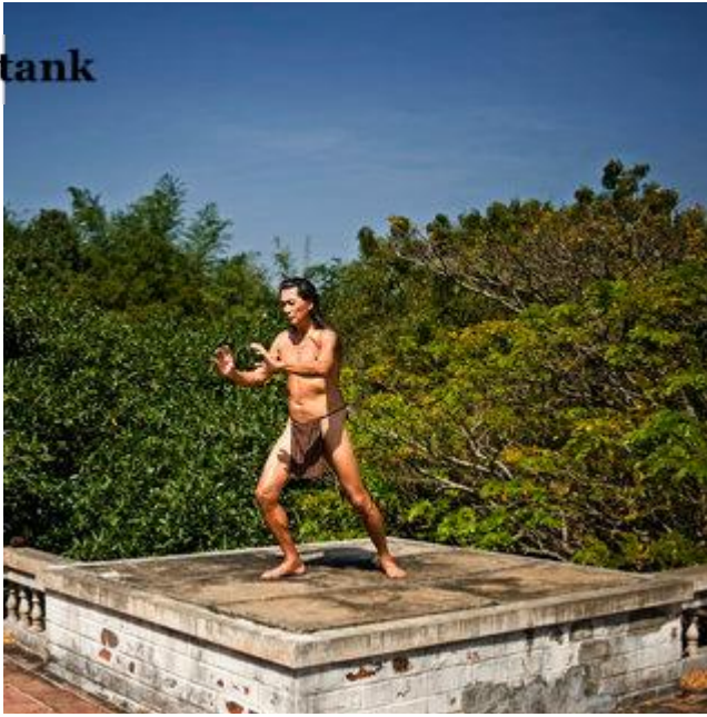
Aldo Sperber / Picturetank SPA0337151

Tlaloc est d'origine hawaïenne. Il est venu pour son master sur la reforestation à Auroville en 1974 . Après cela, il a énormément voyagé, dont à 13 reprises en Inde. Il est Aurovillien depuis 2004 et enseigne le tai-chi après avoir pratiqué en parallèle le yoga pendant 20 ans.