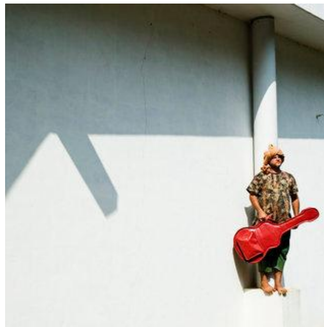
Aldo Sperber / Picturetank SPA0337124

UTILISATIONS EDITORIALES RESPECTANT LEGENDE ET CONTEXTE. AVEC AUTORISATION SIGNEE OU ORALE. Infos : +33(0)143 15 63 53.