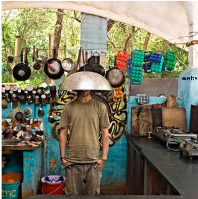
Aldo Sperber / Picturetank SPA0337120

Martin est allemand, c'est son premier séjour à Auroville, il compte revenir et peut-être un jour devenir aurovillien. Mais pour le moment il ne se pose pas réellement la question; "La terre est vaste", dit-il avec l'envie de la découvrir. Pendant son séjour il a participé au maximum à la vie communautaire. Ici il aide à la cuisine du " youth center ".