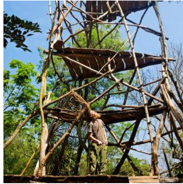
Aldo Sperber / Picturetank SPA0337119

UTILISATIONS EDITORIALES RESPECTANT LEGENDE ET CONTEXTE. AVEC AUTORISATION SIGNEE OU ORALE. Infos