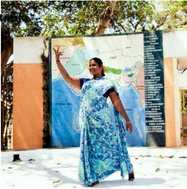
Aldo Sperber / Picturetank SPA0337137

Usha est né à Auroville. Elle est professeur à l'école primaire de New Creation, école où elle même était élève dans son enfance. Elle pratique et enseigne en parallèle la danse classique indienne.