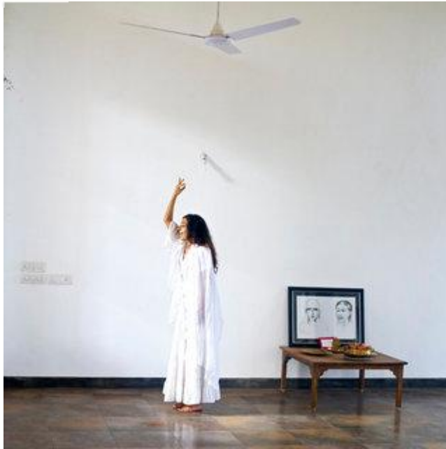
Aldo Sperber / Picturetank SPA0337118

Oum-Hani habite en Pays cathare mais fait des allers-retours fréquents à Auroville depuis longtemps. Chanteuse diplômée du conservatoire de Boulogne-Billancourt (Paris) en art lyrique, elle étudie la résonance vibratoire/sonore et ses phénomènes sur l'être dans sa globalité. Elle étudie également le chant byzantin, le chant soufi arabo-andalous... Elle aime l'énergie qui se dégage d'Auroville, ainsi que les rencontres que l'on peut y faire. Elle ne songe pas pour autant s'y installer définitivement.