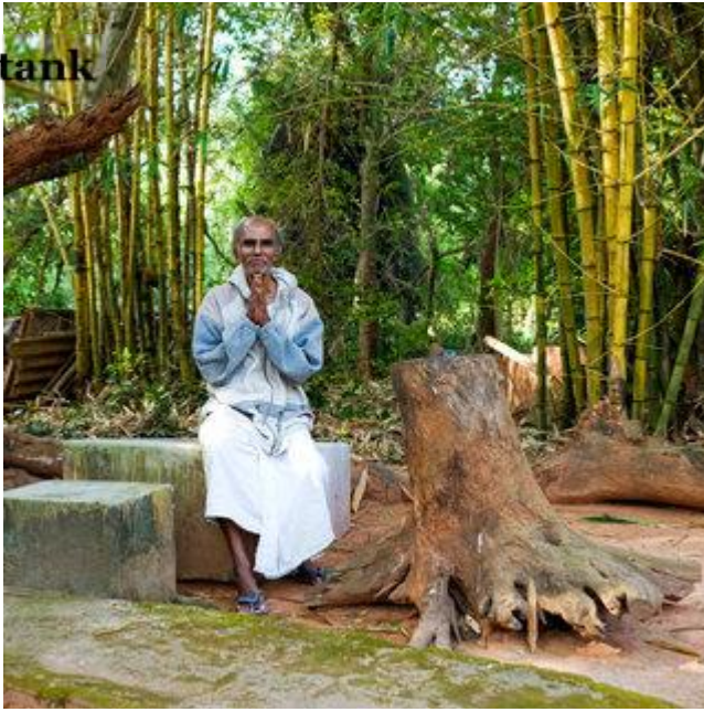
Aldo Sperber / Picturetank SPA0337102

Samarundavan vivait et enseignait la biologie à Madurai. Il est aujourd'hui retraité et Aurovillien depuis 2003.