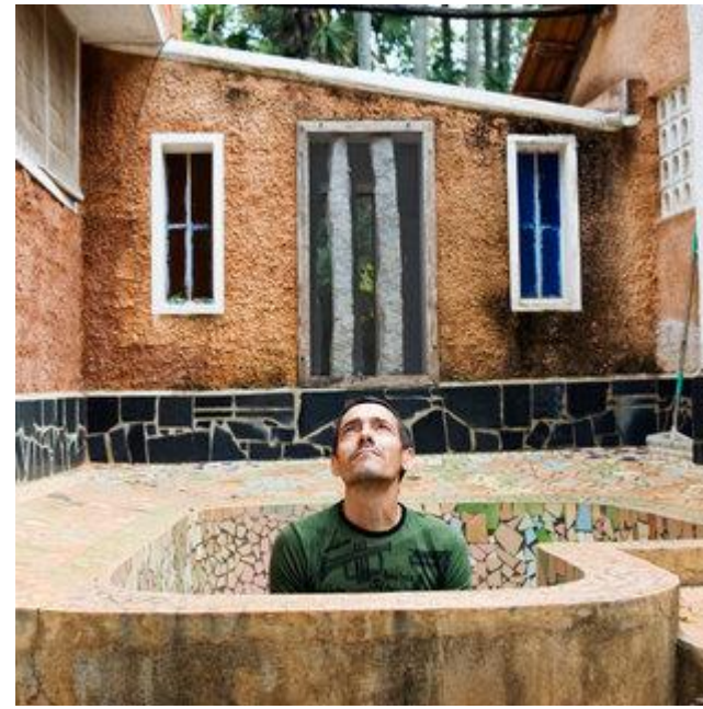
Aldo Sperber / Picturetank SPA0337106

UTILISATIONS EDITORIALES RESPECTANT LEGENDE ET CONTEXTE. AVEC AUTORISATION SIGNEE OU ORALE. Infos : +33(0)143 15 63 53.